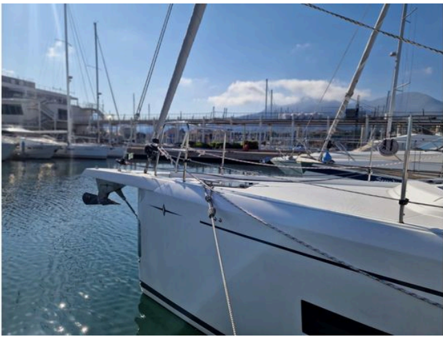
2024 Bavaria Cruiser 46 yacht docked in a marina under a clear blue sky.