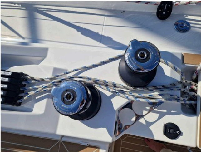
Winches and ropes on a 2024 Bavaria Cruiser 46 yacht deck.