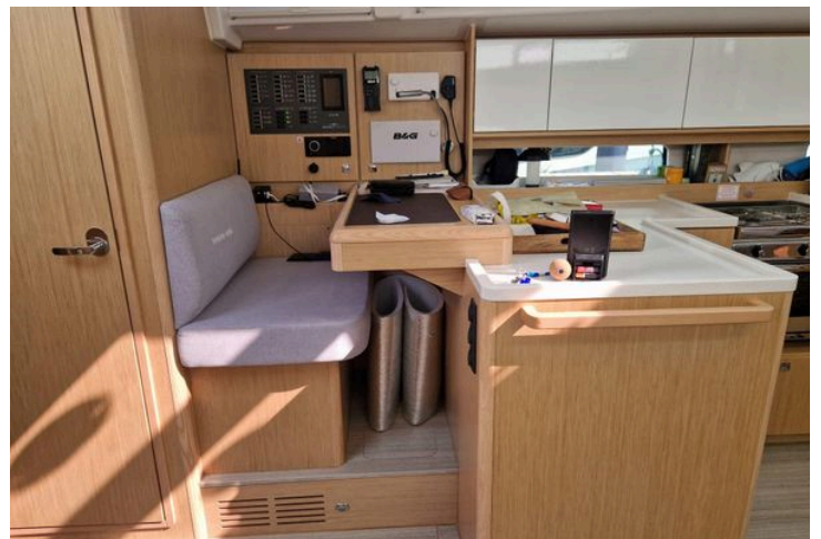
Interior of 2024 Bavaria Cruiser 46 yacht with navigation station and modern kitchen area.