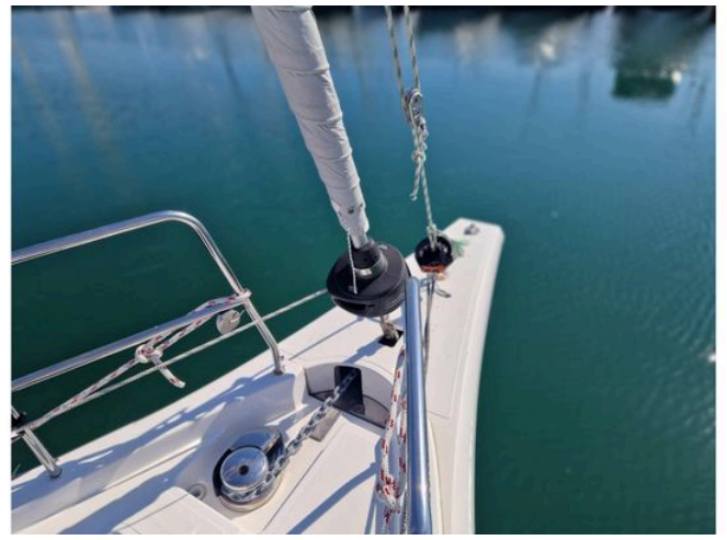
Close-up of 2024 Bavaria Cruiser 46 yacht deck with railing and winch.