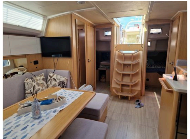
Interior of 2024 Bavaria Cruiser 46 yacht, featuring modern design and cozy seating area.