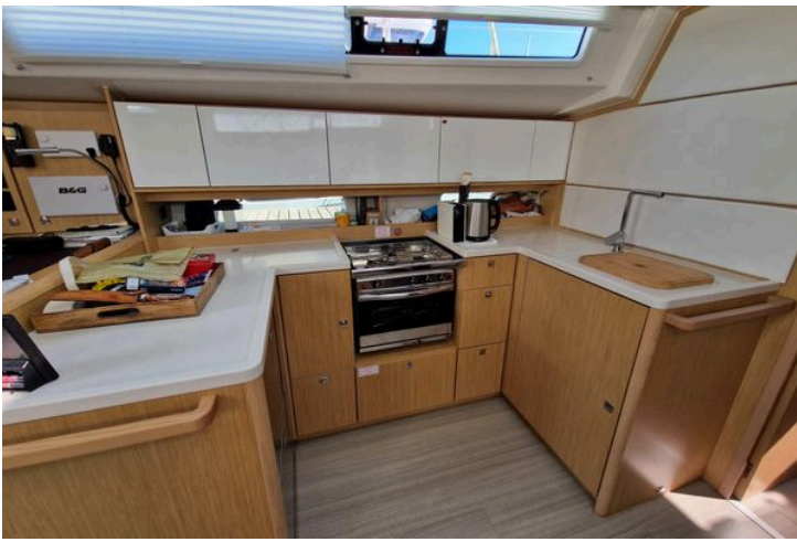
Modern kitchen interior of 2024 Bavaria Cruiser 46 yacht with stove and sink.