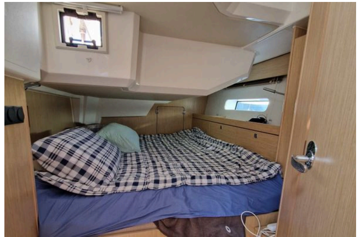
Cozy cabin interior of 2024 Bavaria Cruiser 46 yacht with plaid bedding and wooden finish.