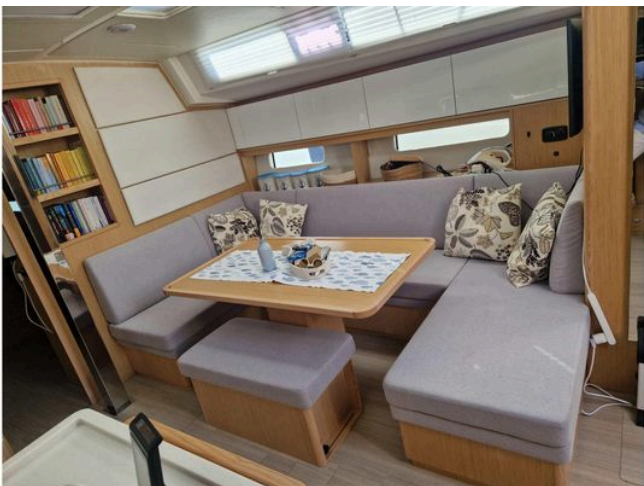
2024 Bavaria Cruiser 46 interior with cozy seating and decorative pillows.