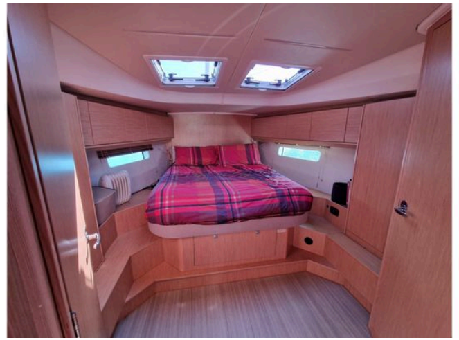
Luxurious cabin interior of 2024 Bavaria Cruiser 46 yacht with cozy bed and wooden finish.