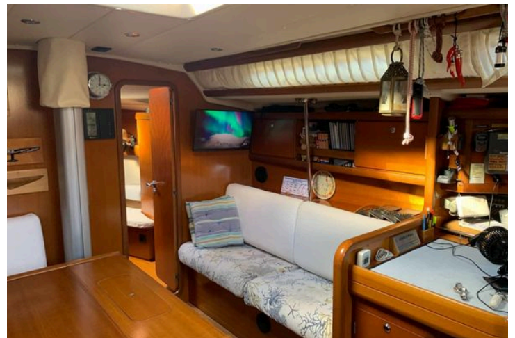
Cozy interior of 2003 Grand Soleil 45 sailboat with wooden furnishings and nautical decor.