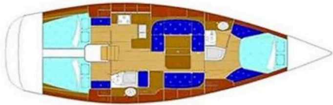
Floor plan of a 2003 Grand Soleil 45 sailboat, featuring cabins and seating areas.