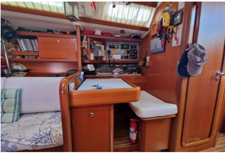
Interior of 2003 Grand Soleil 45 yacht with navigation station and wooden cabinetry.