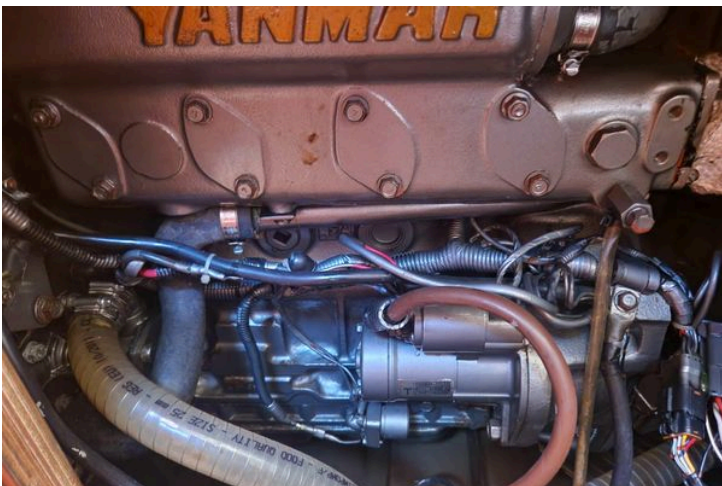
Engine compartment of a 2003 Grand Soleil 45 sailboat with Yanmar components.