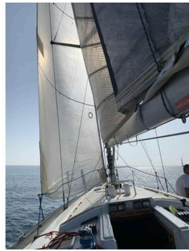
Sailing on a 2003 Grand Soleil 45 yacht with full sails on a sunny day.