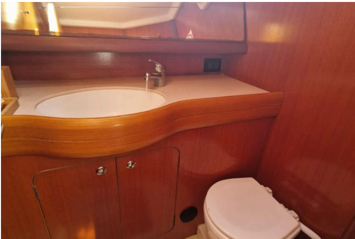
Grand Soleil 45 (2003) yacht bathroom with wooden cabinetry, sink, and toilet.