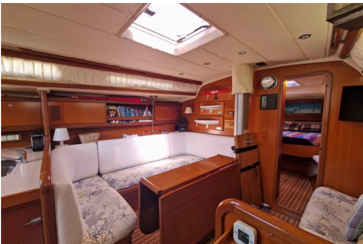
Interior of 2003 Grand Soleil 45 yacht with cozy seating and wooden finishes.