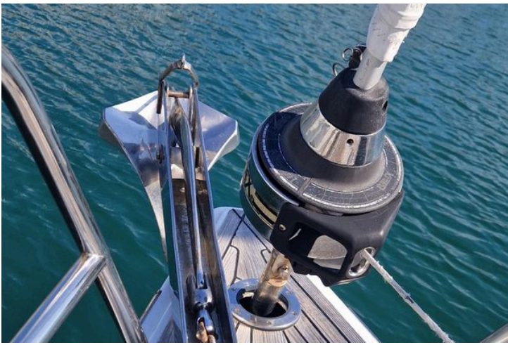
Bow of 2003 Grand Soleil 45 yacht with anchor and furler system.