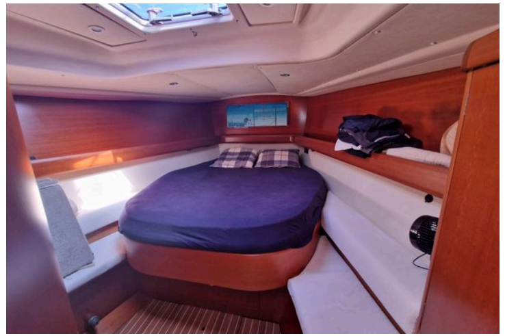
Cozy cabin interior of 2003 Grand Soleil 45 sailboat with wooden finish and skylight.