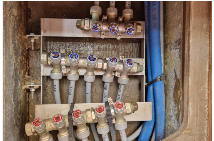
Plumbing system with valves and pipes on a 2003 Grand Soleil 45 yacht.