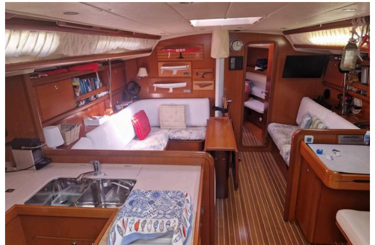
Luxurious interior of a 2003 Grand Soleil 45 yacht, featuring cozy seating and elegant wood finishes.