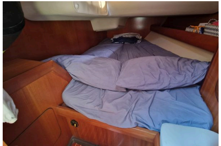
Cozy cabin interior of 2002 Grand Soleil 43 sailboat with blue bedding.