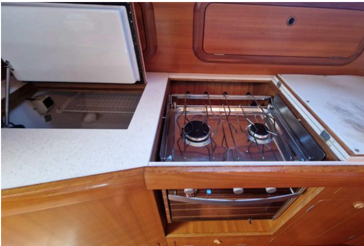
Kitchen area of 2002 Grand Soleil 43 yacht with stove and storage.