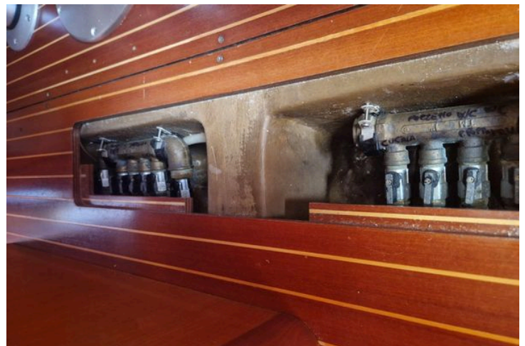
Interior view of a 2002 Grand Soleil 43 yacht's wooden paneling and plumbing system.