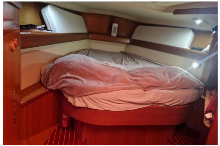
Cozy cabin interior of 2002 Grand Soleil 43 sailboat with wooden finish and bedding.