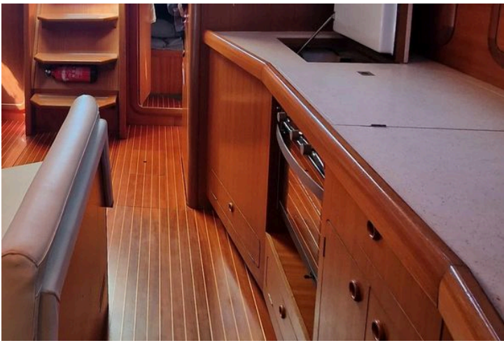
Interior of 2002 Grand Soleil 43 yacht with wooden cabinetry and seating.