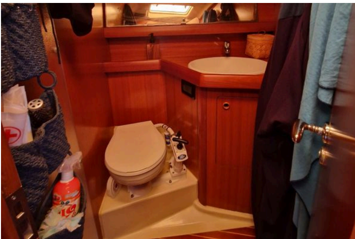
Grand Soleil 43 yacht bathroom with wooden cabinetry, toilet, and sink, 2002 model.