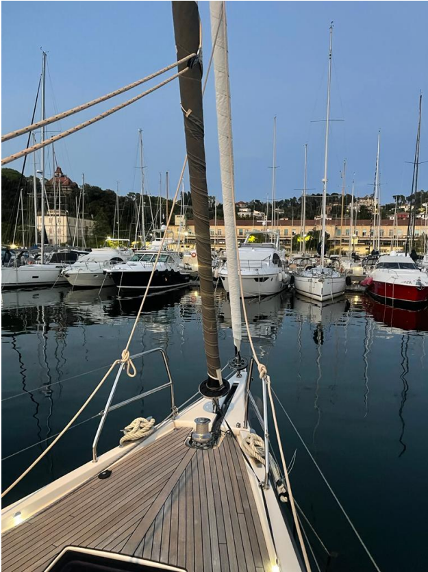
foto aggiornate 09.2023 - Dufour 56 Exclusive