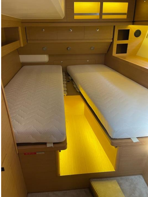
foto aggiornate 09.2023 - Dufour 56 Exclusive